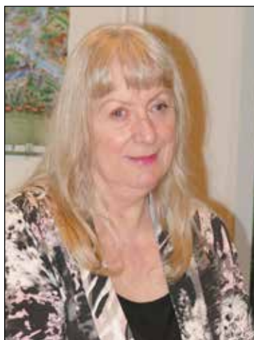
Met pensioen PAGINA 3