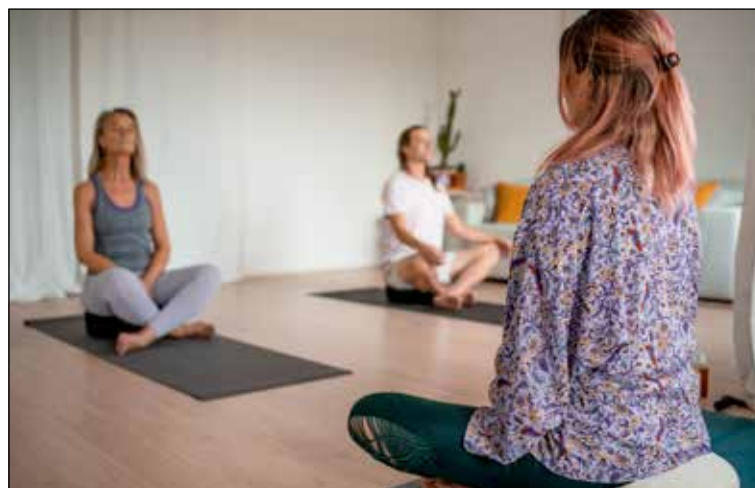
De Yoga homestudio PAGINA 3