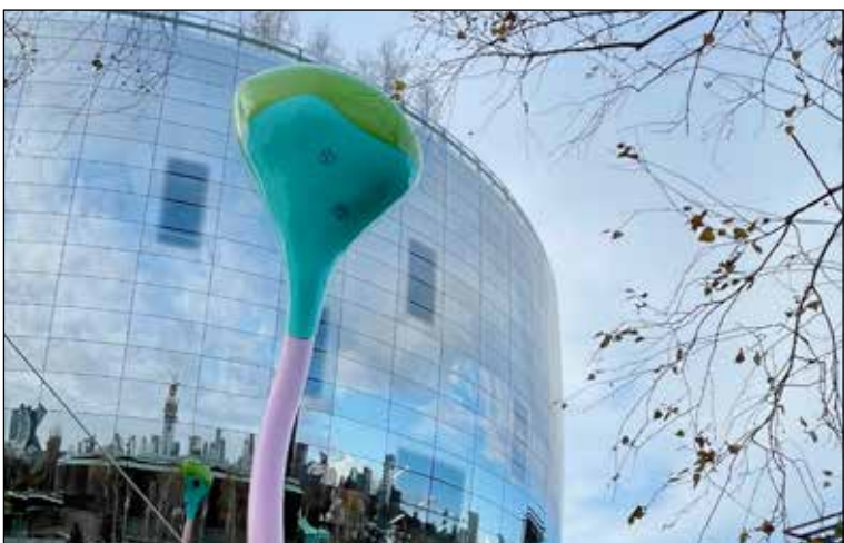
We Beeld This City # 41 PAGINA 2