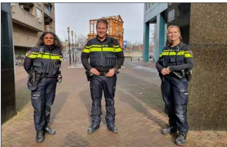
De drie wijkagenten van Stadsdriehoek PAGINA 3