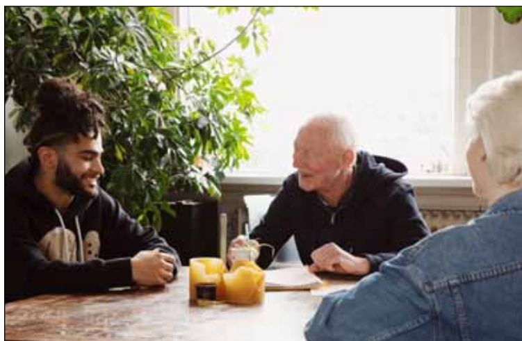
Jonge kunstenaars vormen een community PAGINA 4

OPROEP AAN ALLE KLEINE ONDERNEMERS IN DE WIJKEN STADSDRIEHOEK EN COOL! GRATIS ADVERTEREN IN DEZE KRANT!